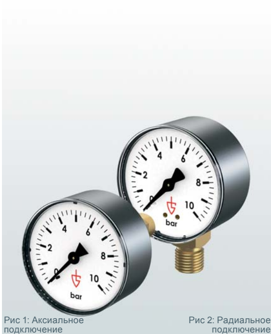
Рис 1: Аксиальное подключение

Для манометров с подключением из нержавеющей стали корпуса изготавливаются также из нержавеющей стали. Такие манометры допустимо использовать в системах агрессивными средами, или в агрессивной окружающей среде.